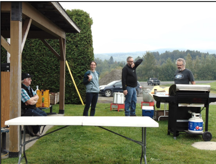
On s'installe pour les festivités