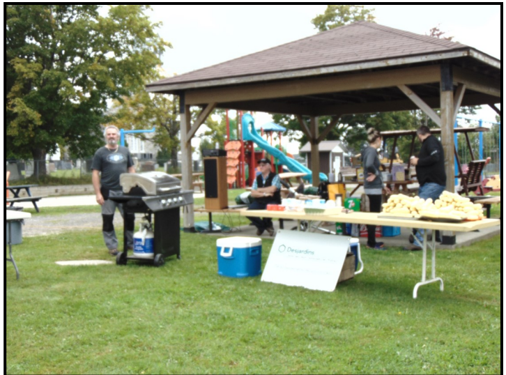
On est prêt, on vous attend. Photo du bas, on mange.

Le comité des Loisirs de St-Herménégilde est très heureux de la participation des citoyens pour la toute première édition de la Fête des mégiliens qui a eu lieu le 8 septembre dernier. Malgré la température maussade, l'activité est une réussite puisque 75 citoyens se sont présentés pour manger du bon blé d'inde et des hot-dogs.