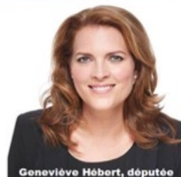
Geneviève Hébert, députée