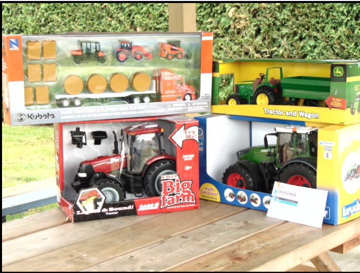
Les prix de présences